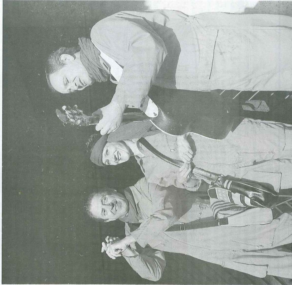
ROUEN. Sur la place du Vieux-Marché, les Beatles font la cour à Michelle d'Arc, la sœur de Jeanne

■ Prochaines visites samedis 23 et 30 août à 18 h 30. Renseignements et réservations à l'office de tourisme au 02.32.08.32.40. Tarifs : 6,50 € plein, 4,50 € réduit, gratuit pour les moins de 12 ans.